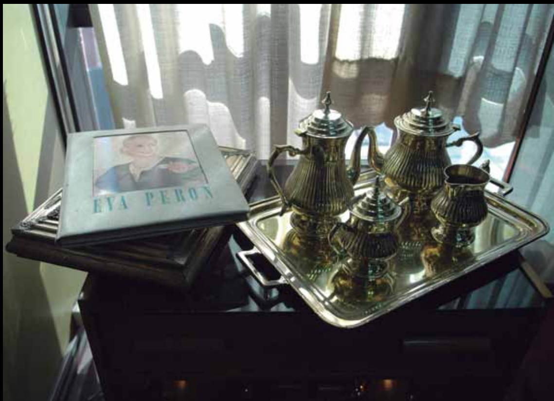
Despacho de Manuel Quindimil, Intendente del Partido de Lanús, 2007.