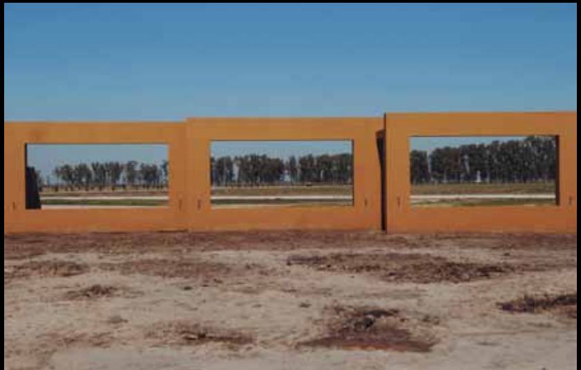
Campos de Roca Barrio privado