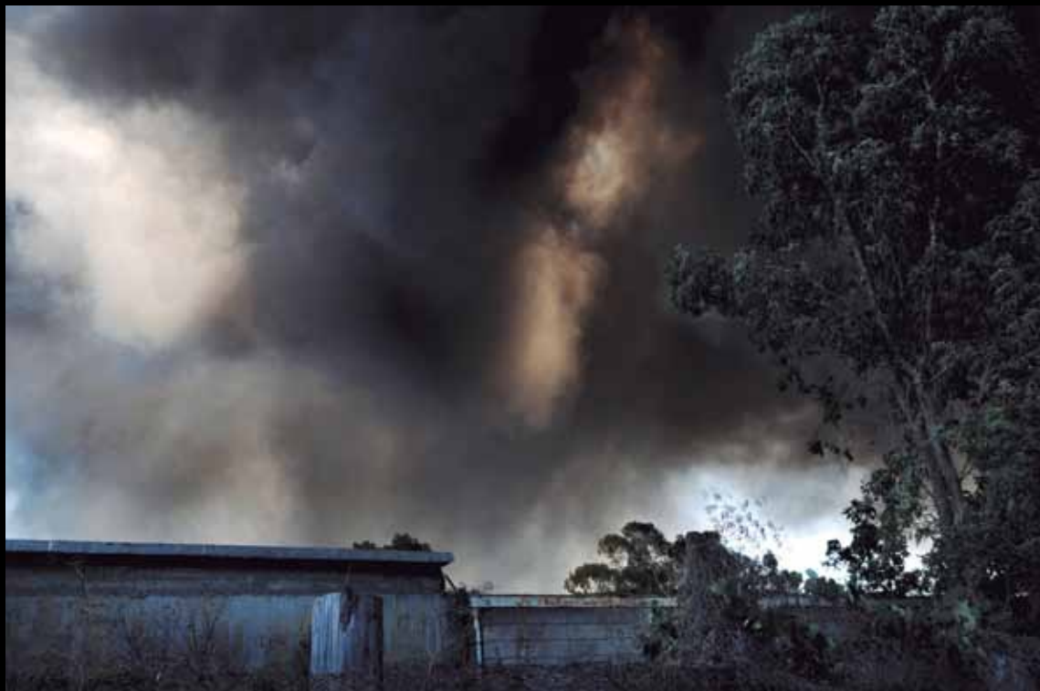
Cerco perimetral de una cementera. José León Suárez, 2011.